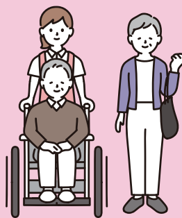
介護保険制度の利用に関する相談