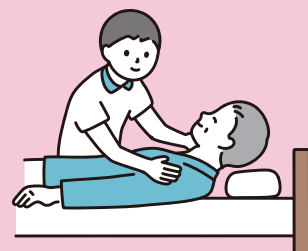
在宅医療 (訪問診療・訪問看護) に関する相談